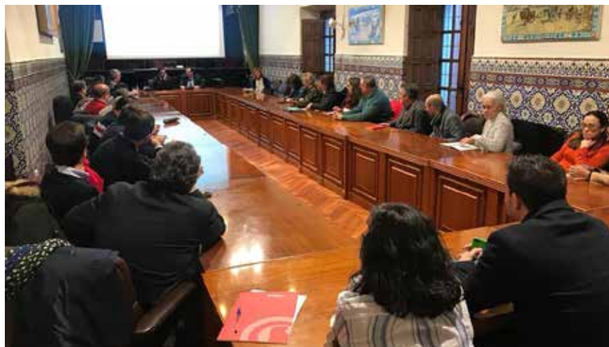
JORNADAS IMPARTIDAS POR EL DESPACHO GARRIDO.- Las jornadas impartidas sobre los derechos del empresario ante la entrada en sus oficinas de la Inspección de Hacienda por el despacho Garrido tuvieron un rotundo éxito y llenaron el salón de plenos de la Cámara de Comercio