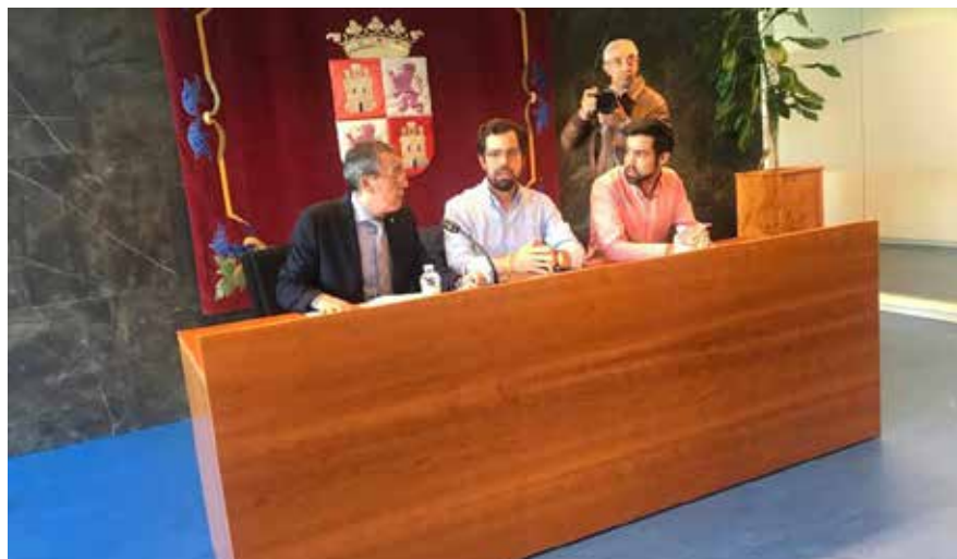
CONSTITUCIÓN MESA PROVINCIAL DE GARANTÍA JUVENIL.- Representantes de AESCO, estuvieron presentes en la Constitución de la Mesa Provincial de Garantía Juvenil que ha tenido lugar en la Delegación Territorial de la Junta de CyL en Salamanca ■

Los cursos, con contenido oficial regulado por el SEPE, están 100% subvencionados por el Ministerio de Trabajo, Migraciones y Seguridad Social, y tienen como finalidad principal dinamizar el acceso de los comerciantes al uso de las nuevas tecnologías, adquiriendo nuevas competencias que les proporcionen ventajas competitivas en su negocio.